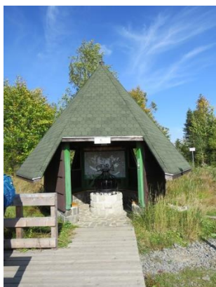
Pramen řeky Odry

2) Pramen řeky Odry se nachází ve vojenském újezdu Libavá na úpatí Fidlova kopce. Pramen byl objeven již v roce 1830 a byla zde vybudována studánka. Tento pramen ale časem vyschnul. Později bylo upraveno jiné místo jako pramen Odry a byl zde vybudován přístřešek. Výlet k prameni je povolen pouze o víkendech a svátcích.