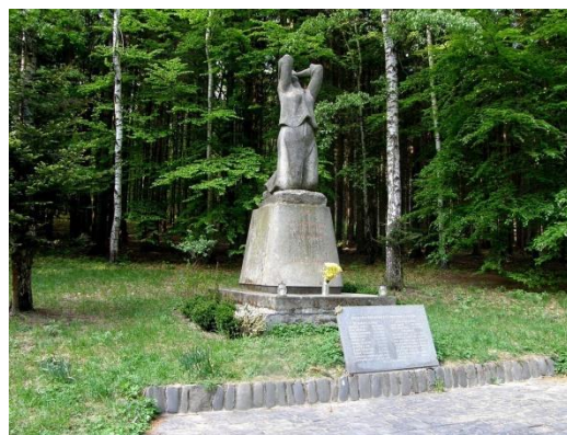
Památník Zákřovský Žalov

2) Pramen řeky Odry se nachází ve vojenském újezdu Libavá na úpatí Fidlova kopce. Pramen byl objeven již v roce 1830 a byla zde vybudována studánka. Tento pramen ale časem vyschnul. Později bylo upraveno jiné místo jako pramen Odry a byl zde vybudován přístřešek. Výlet k prameni je povolen pouze o víkendech a svátcích.